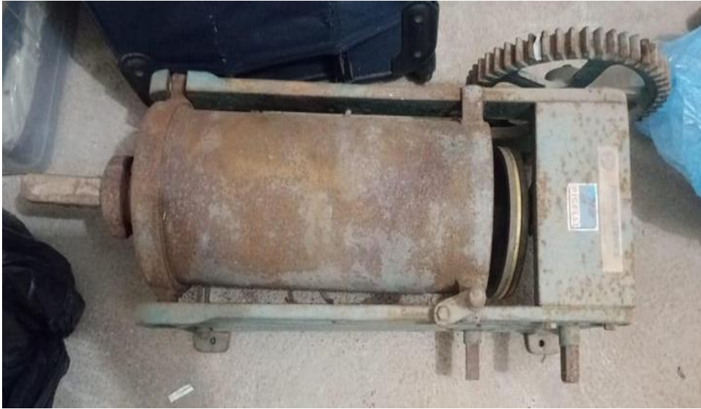
01 - Canhão (embutidor de linguça), manual, fabricante Picelly