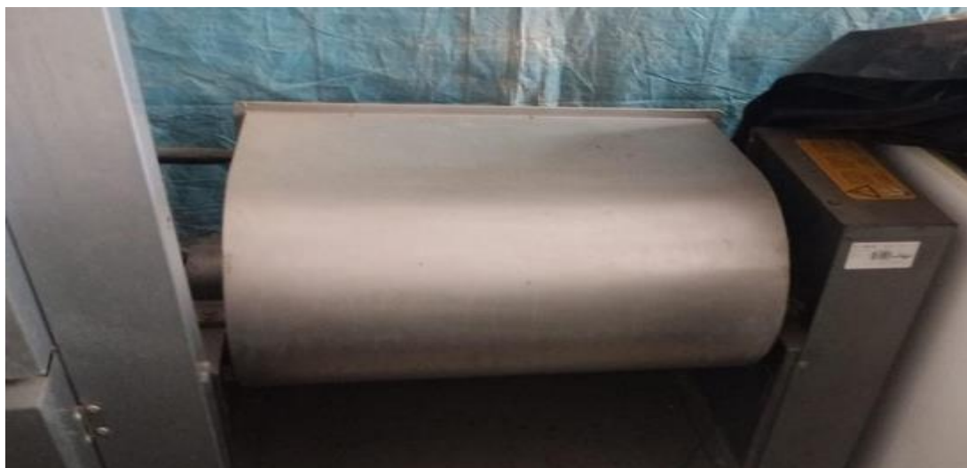
01 - Misturador de carne inox, fabricante Skymesen