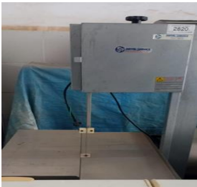
01 - Serra de arco com bancada de inox