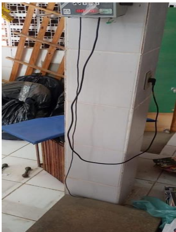
01 - Balança de fabricante Urano