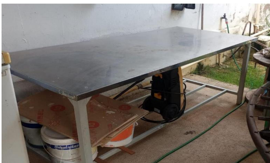
01 – Mesa de Inox