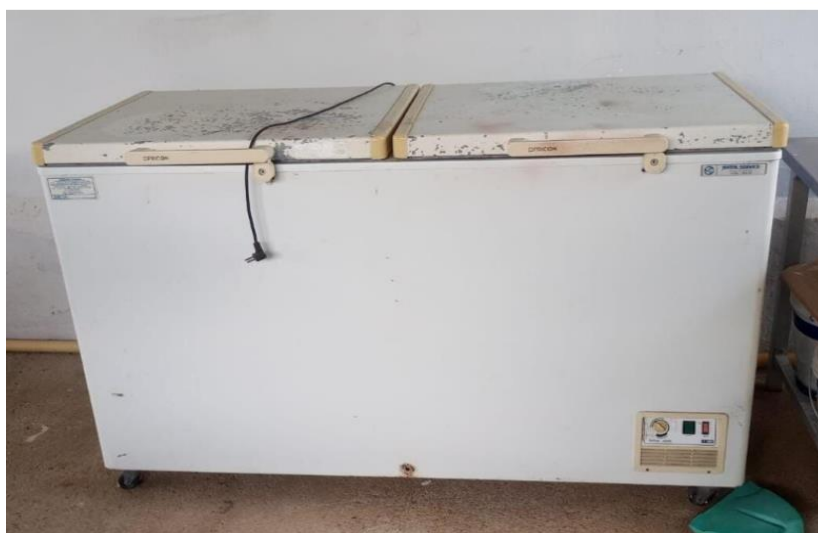
01 - Freezer de marca Fricon com duas portas, cor branco