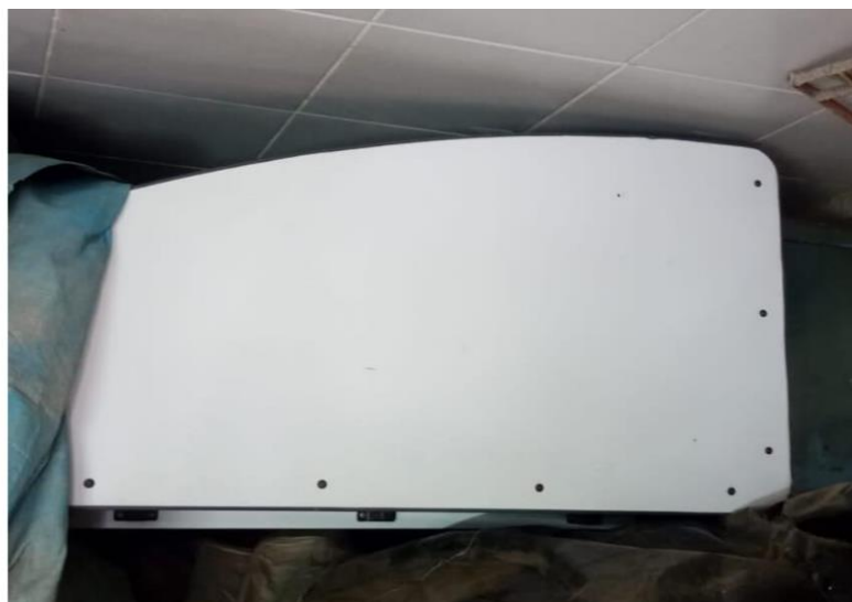
01 - Balcão de inox de marca Termisa com duas portas