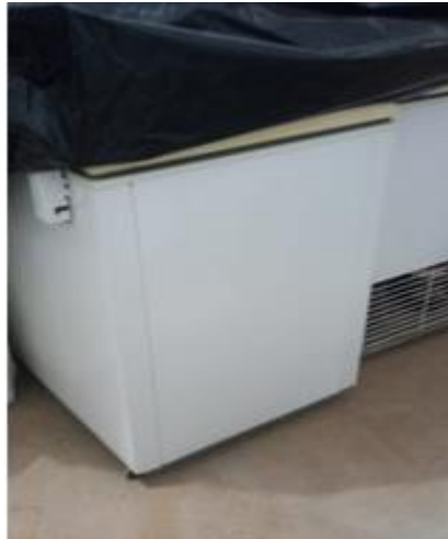
03 - Freezers de marca Metalfrío, com duas portas, horizontal